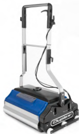
ESCALATOR BASE 350-550