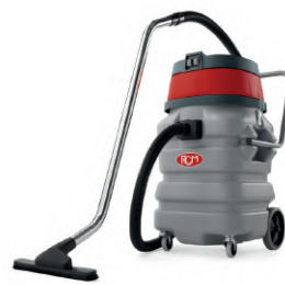
WET* 902 902 PUMP*