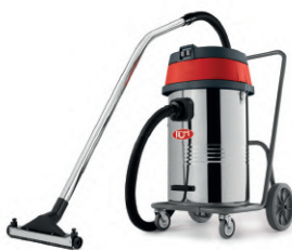
WET 803 T